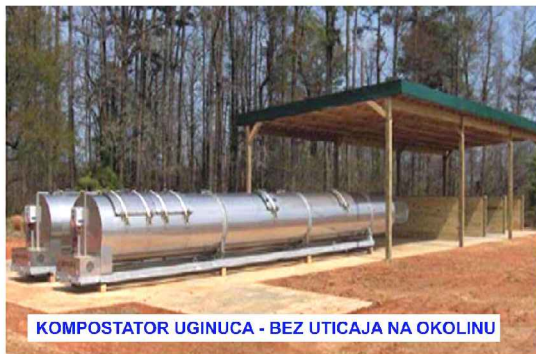
KOMPOSTATOR UGINUCA - BEZ UTICAJA NA OKOLINU