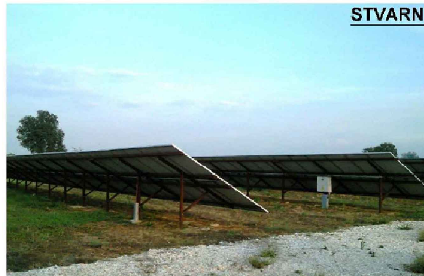
STVARNI IZGLED PANELA