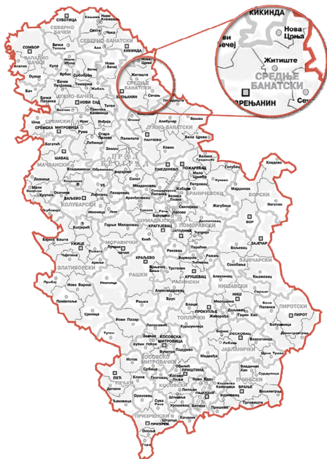
Слика 1: Положај општине Житиште